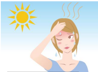
Incidência da luz do Sol