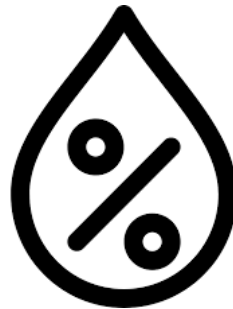
Umidade do ar